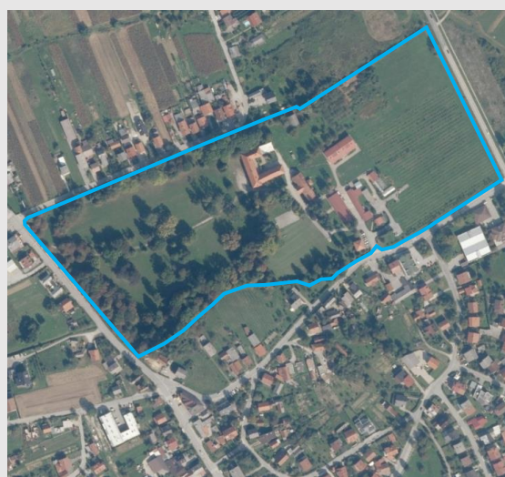
Povijesni katastar imanja iz 1862., zona zaštite na DOF podlozi: