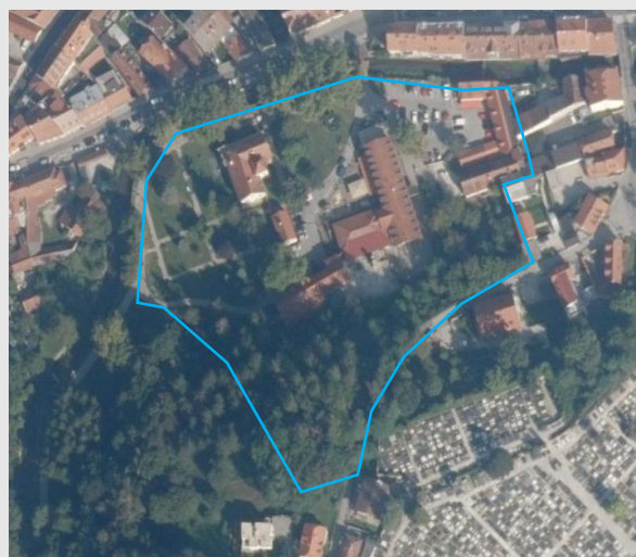
Povijesni katastar iz 1862. godine, zona zaštite na DOF podlozi