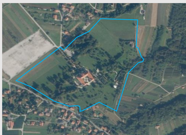
Povijesni katastar imanja 1862., zona zaštite na DOF podlozi