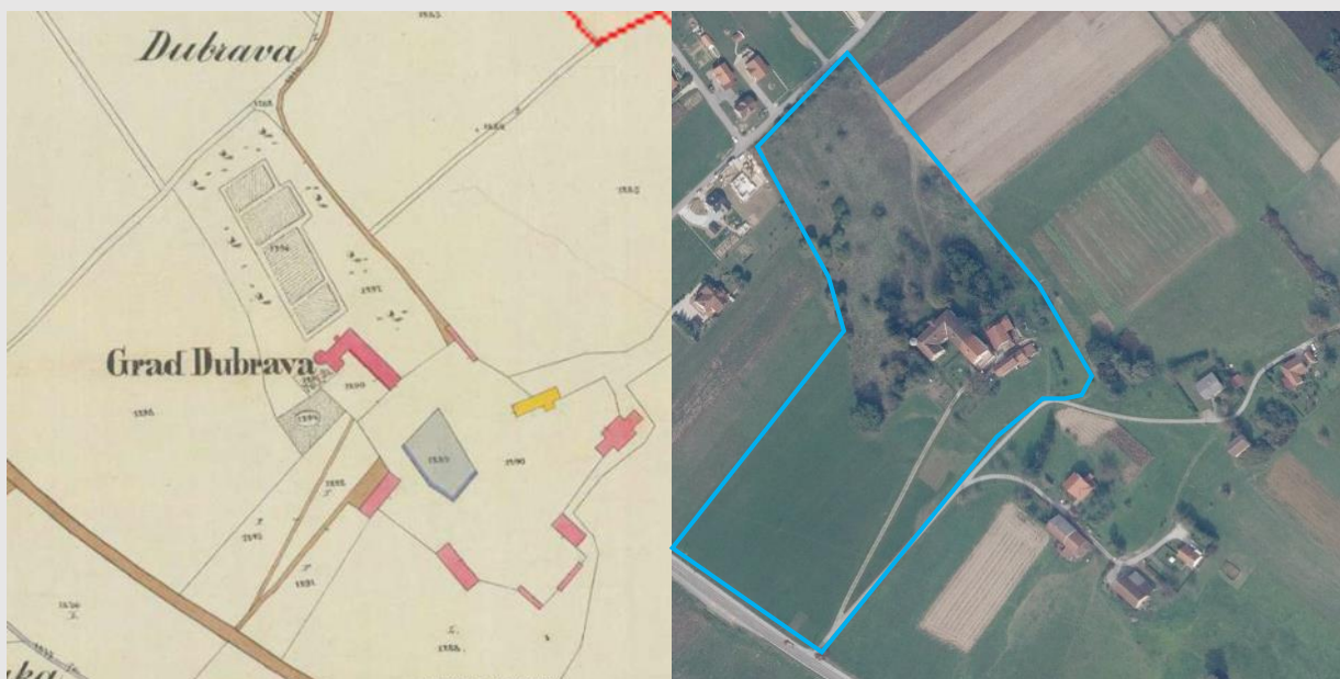
Povijesni katastar imanja iz 1861., zona zaštite na DOF podlozi