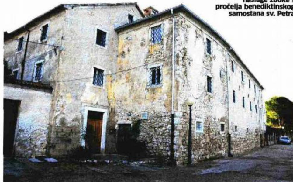
Uklonjene neadekvatne naslage žbuke s pročelja benediktinskog samostana sv. Petra

tanu sv. Frane, skulpturu sv. Jurja iz 16-17. st. iz Creskog muzeja, te za Callido orgulje iz 1829. iz župne crkve sv. Marije Velike. Time se iznos što će se uložiti u obnovu kulturnih dobara u Cresu ove godine penje na gotovo milijun kuna!