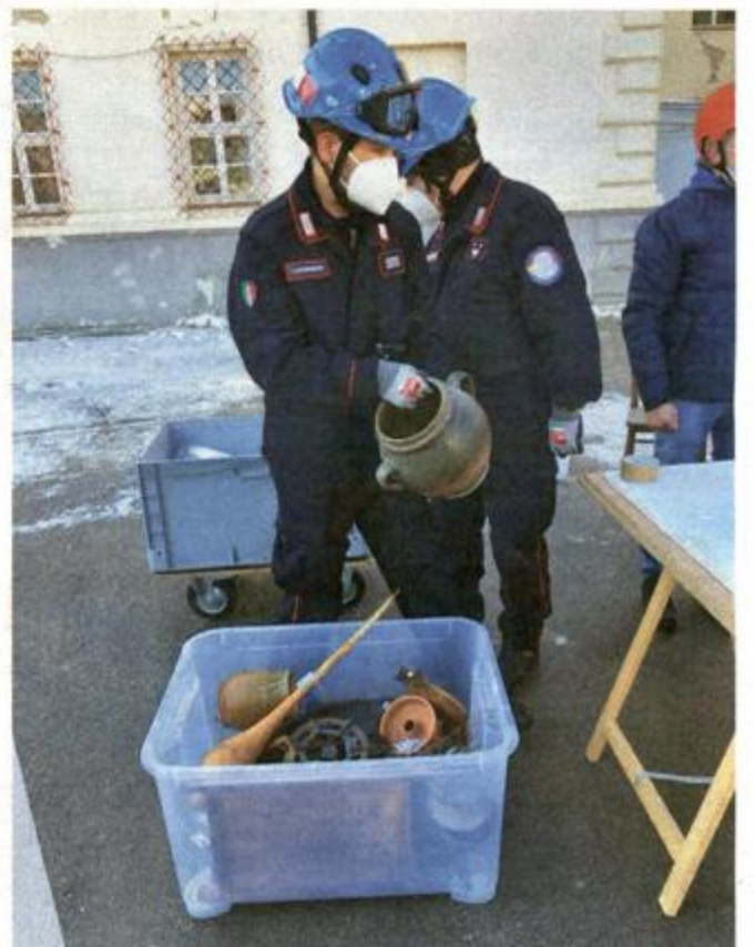
U Petrinju su kao pomoć stigle i talijanske Plave kacige

Na sigurno je premješteno 300 slika, crteža, grafika, fotografija i skulptura iz petrinjske Galerije 'Krstu Hegedušić', kao i Etnografska zbirka Hosi iz zgrade Srednje škole, ikone s ikonostasa pravoslavne crkve sv. Nikole te sakralni inventar iz župne crkve sv. Pohoda Blažene Djevice Marije u Starom Farkašiću