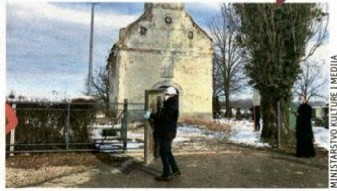
Evakuacija vrijednosti iz crkve sv. Nikole

Početak prošloga mjeseca na ispomoć hrvatskom timu na Baniji stigli su pripadnici posebne jedinice, talijanske „Plave kacige“, kako bi pomogli iskustvom i znanjem stečenim u sličnim elementarnim nepogodama