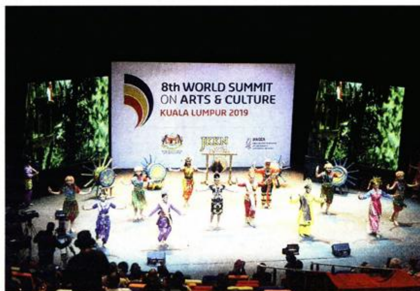
Svečano otvaranje održano je u botaničkom vrtu uz tradicionalnu glazbu i plesove