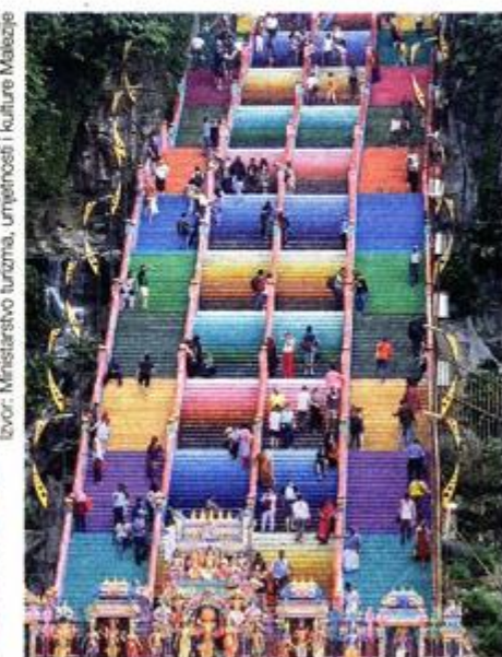
Ulaz u hinduistički hram u špiljama Batu

Umjetnost i kultura nude bezbroj perspektiva i nadahnuća koja mogu obogatiti. Uključenost i sudjelovanje ključevi su naše sposobnosti da odgovorimo izazovima budućnosti, poruke su 8. svjetskog samita umjetnosti i kulture održana u Kuala Lumpuru