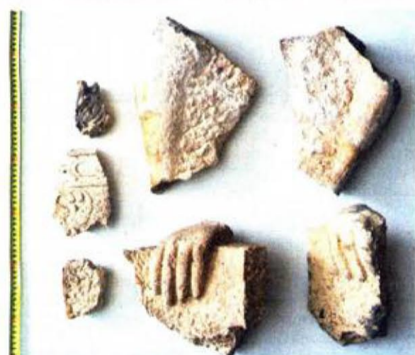
Fragmenti skulpture ruku koje vjerojatno drže krunu

na, donose odluke koje, među ostalim, provode i pravdu. S druge strane, jamac pravde, kruna toga ustroja je Bog, odnosno okrunjena Gospa. Ne bi me iznenadilo da ova skulptura datira iz 15. stoljeća jer neki elementi upućuju na Andriju Alešija, majstora toga doba, ali, naravno, to je zasad samo spekulacija – kaže Bužančić. Radovi na zapadnom ulazu u Palaču koji se nastavljaju, međutim, dio su još šireg konteksta radova na obnovama zgrada koji su u pripremi i koji se već izvode na splitskoj Pjaci. Konzervatori, naime, nastoje ponovno vratiti dio sjaja tom prostoru koji je još od 13. stoljeća bio središnji prostor grada na kojem je pulsirao život Splita, a koji je izgubio dio nekadašnjeg sarma. No to je, štoto bi se reklo, neka druga priča. ●