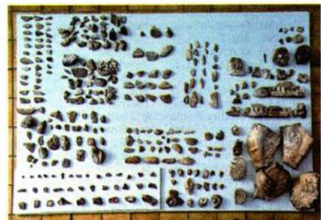
Skulpturu su u Hrvatskom restauratorskom zavodu sklopili iz 350 komadića

Ne bi me iznenadilo da ova skulptura datira iz 15. stoljeća, jer neki elementi upućuju na Andriju Alešija, majstora toga doba, ali, naravno, to je zasad samo spekulacija – kaže Bužančić