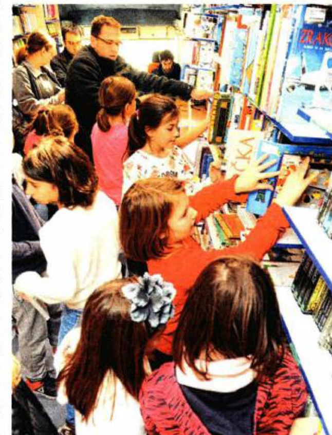
Djeca vole čitati sve što je namijenjeno njihovom uzrastu