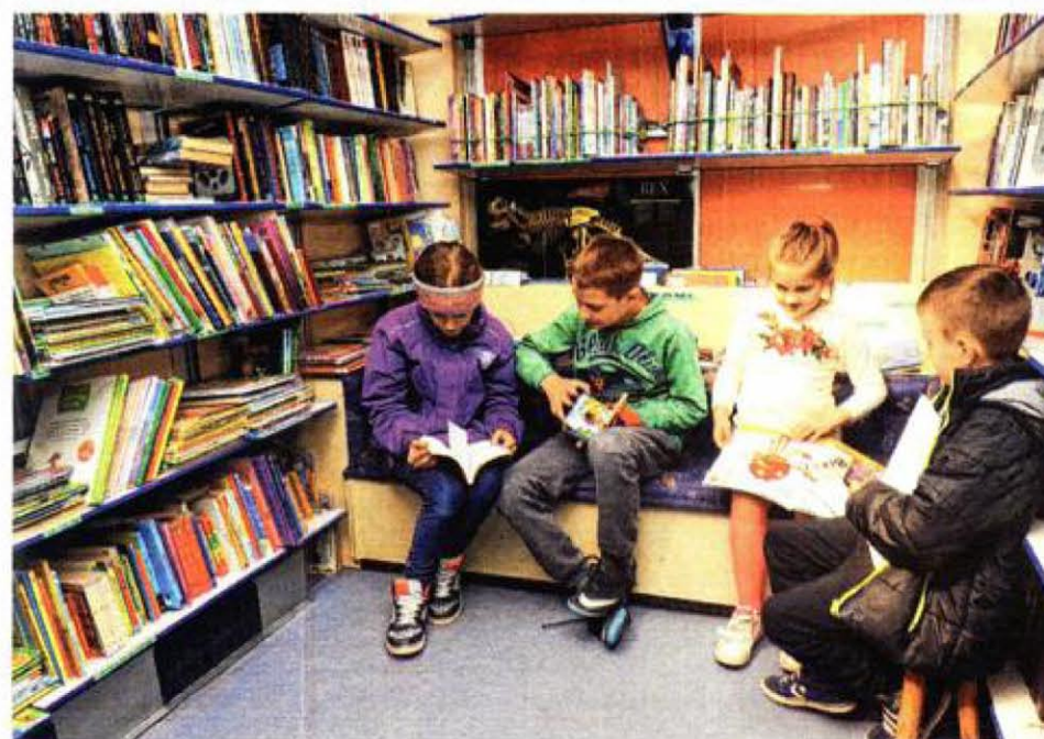
Putujuća knjižnica ima baš sve što treba, čak i klupicu za čitanje