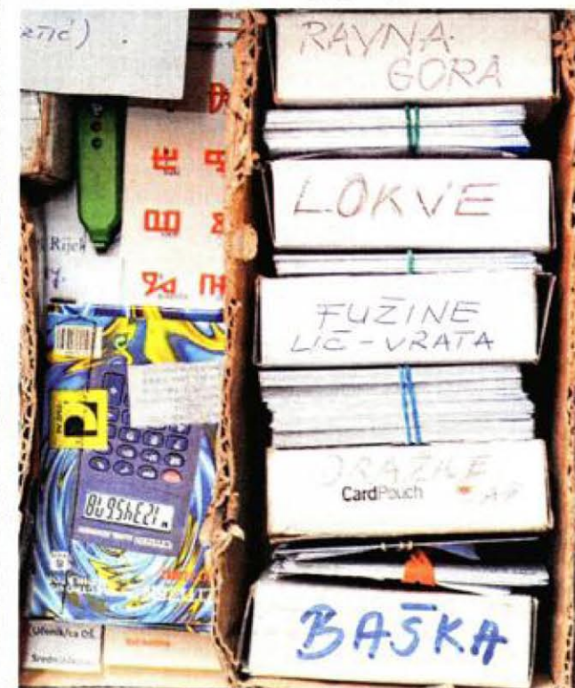
Bibliobus obilazi i zelene i plave dijelove županije

ciljem približavanja čitatelja temama koje često traže ili knjigama koje knjižničari preporučuju, pa se tako mogu pronaći »knjige s osmijehom«, »dajte mi nešto ljubavno...« ili one nove »ispod čekića«, a ne smije se zaboraviti Goranska zavičajnu zbirku i knjige koje su prethodno provjerili brojni čitateljski klubovi koji djeluju u Gradskoj knjižnici Rijeka. – Da su čitateljski klubovi