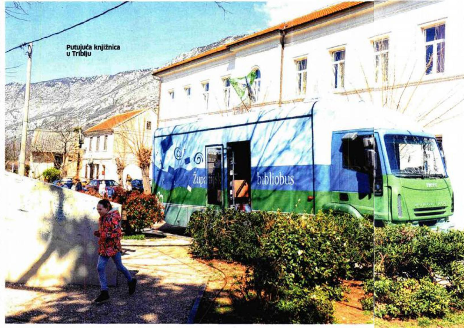
Putujuća knjižnica u Triblju