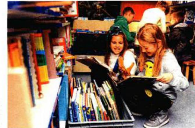
Naslove je najbolje izabrati u društvu

– Ipak, pravi pokazatelj stvarne potrebe ove usluge u marginaliziranim sredinama jest upravo velik broj odraslih koji koriste bibliobus i raduju se svakom novom naslovu. I teško je reći u kojim sredinama se više potvrđuje njegova potreba – u onim malima u kojima mu se svakih 14 dana veseli samo nekoliko, ali vrlo vjernih korisnika kojima je on izuzetno važan segment života, ili u većim mjestima gdje je broj korisnika puno veći i živost stajališta također, mogli bismo reći – podjednako važno. Od skandiranja cijelih vrtičkih grupa u dočekivanju bibliobusa do suza djece i odraslih zbog informacije da njihova općina odustaje od sufinanciranja usluge – županijskom se bibliobusu njegovo mehaničko srce svakodnevno širi i stišće, u svakom slučaju, od prvog dana, on ne može pobjeći od emocija – emocije ga prate na svim njegovim kilometarskim putešestvijama, kaže nam voditeljica Tibljaš. Inače, u bibliobusu su izdvojene razne zbirke knjiga s