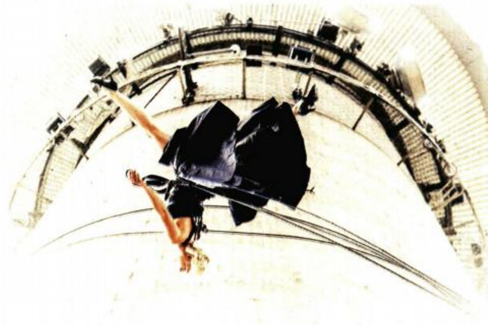
Vertikalni ples, inovativna i zahtjevna umjetničko-sportska disciplina