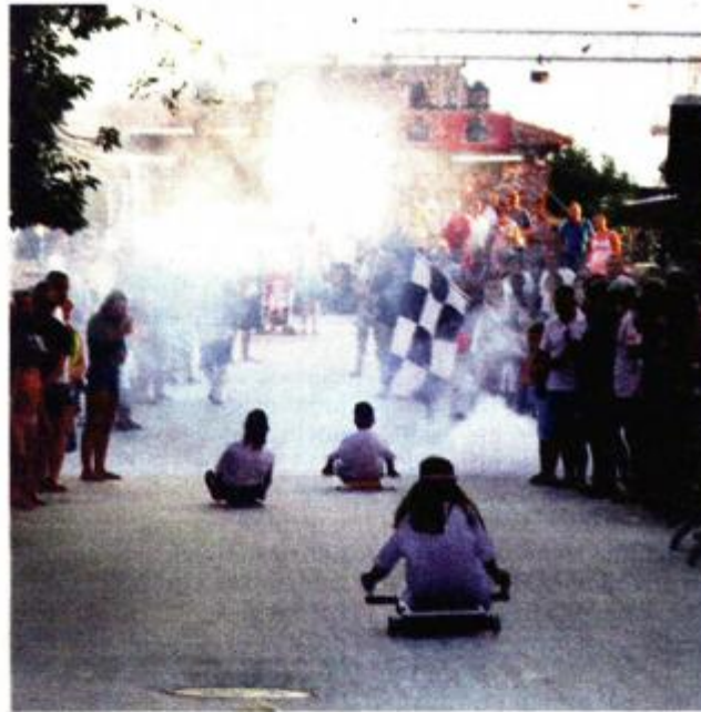
I tradicionalene Balinjere uklopile bi se u novu društveno-kulturnu viziju mjesta