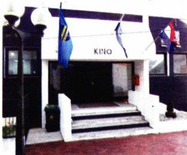
Kinodvorana u centru Sv. Filipa i Jakova