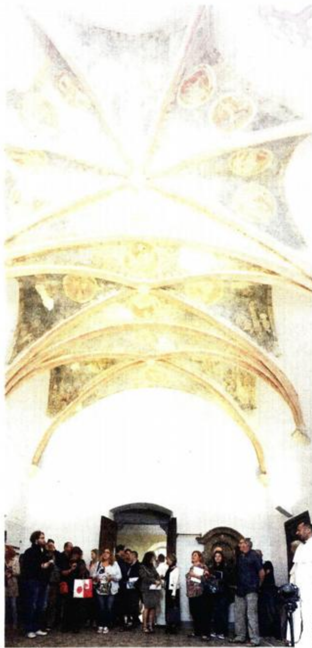
Predstavljanje rezultata restauratorskih radova

Željko Bistović iz Konzervatorskog odjela Rijeka podsjetio je na svoje ranije tvrdnje o izuzetno rijetkom topološkom sustavu, kao i o jednom od rijetkih primjera u kojem su sve četiri personifikacije elemenata prikazane kao ljudski likovi koji jašu životinje