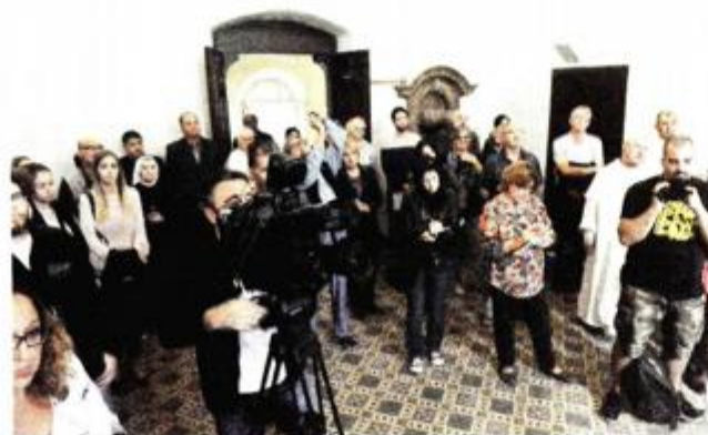
Publika na predstavljanju