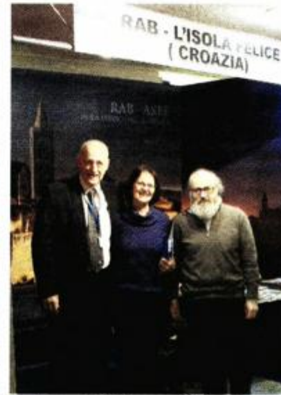
Predstavnici Raba pred štandom