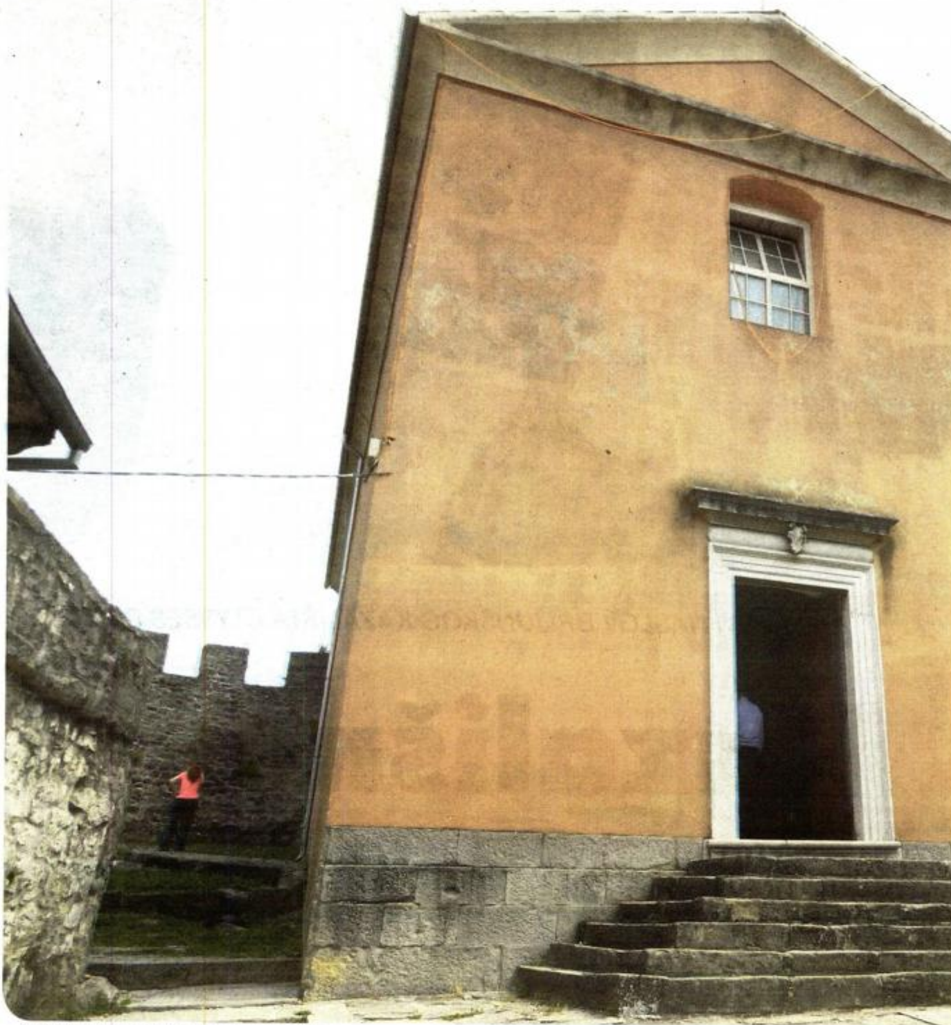
Crkva Sv. Jurja na 152 metra nadmorske visine