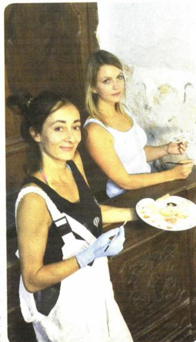
Restoratorice Hrvatskog restauratorskog zavoda

snije samih zidova. U ovoj godini ožbukani su i ofarbani zidovi.