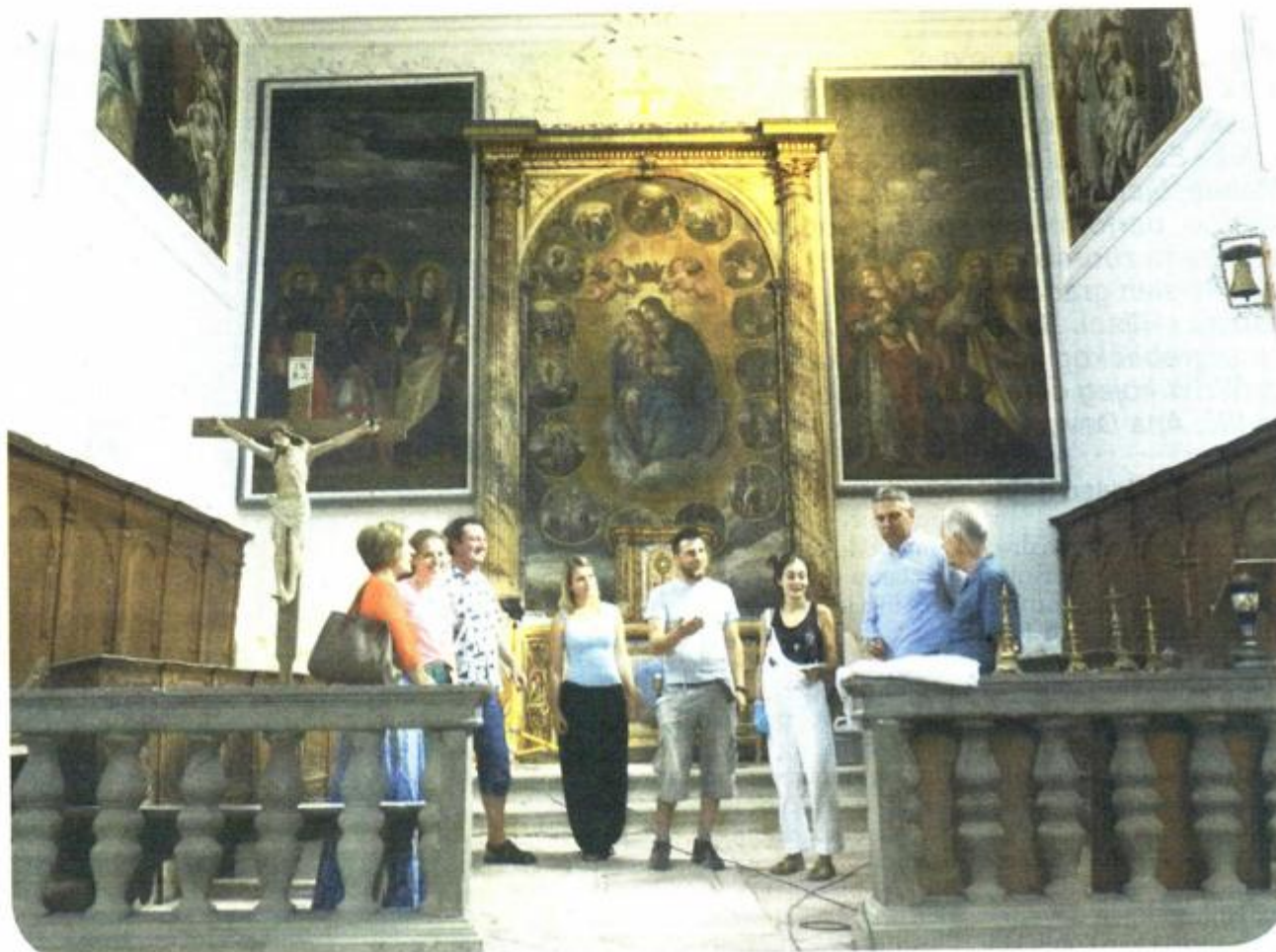
Montirani su glavni oltar i sve zidne slike