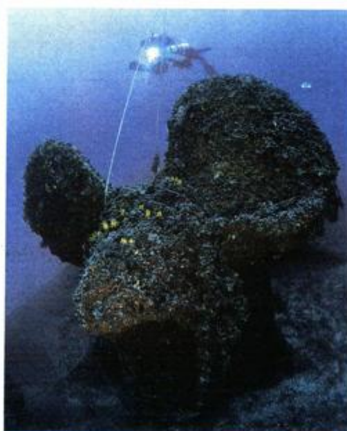
Impresivne podvodne fotografije