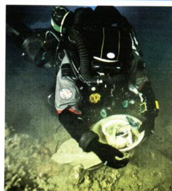
Uroš Jelić skuplja nalaze iz admiralske kabine