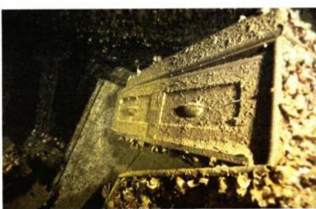
Ladica iz ormara u admiralskoj kabini