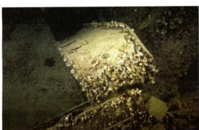
Kada iz admiralske kupaone