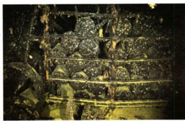
Boksovi sa čahurama 305 mm topovskih granata