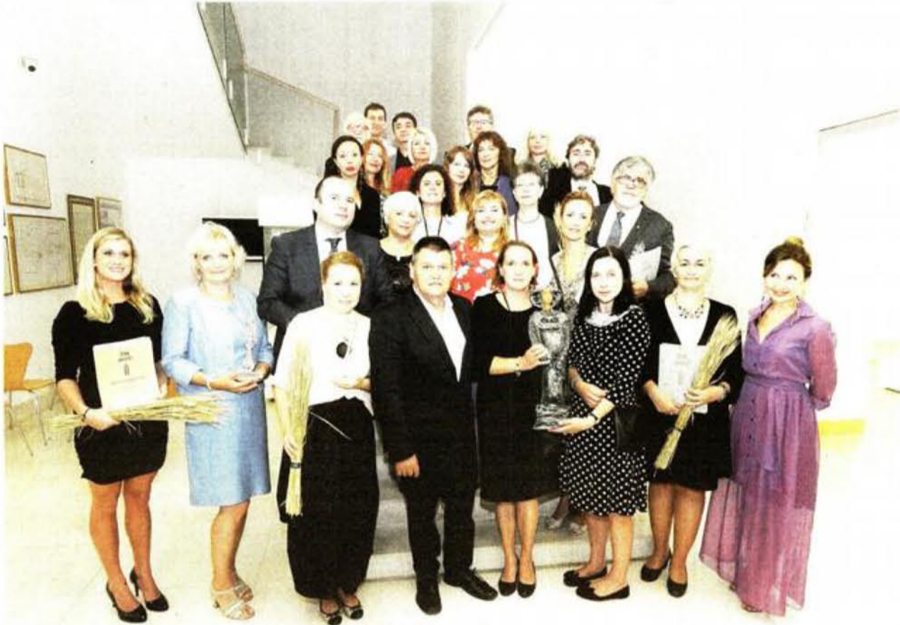
Dobitnici nagrada s priznanjima

Uručeno je ukupno sedam nagrada. Uz navedene nagrađeni su i Muzej vučedolske kulture iz Vukovara, koji je dobio posebno priz-