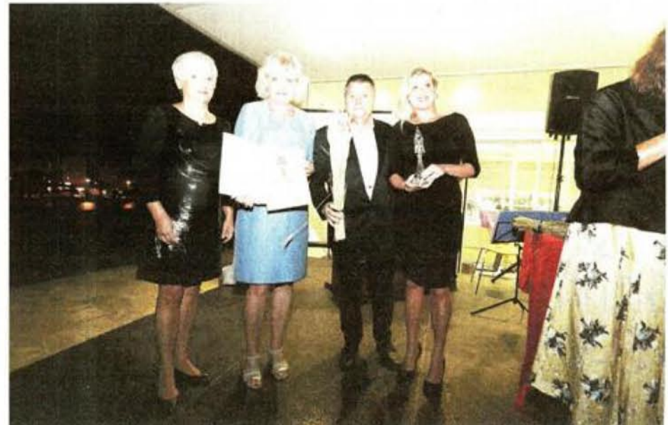
Strečno Castle dobio je nagradu za odličnu komunikaciju s posjetiteljima