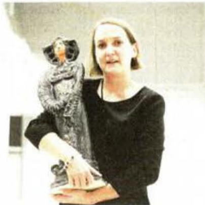
Statua božice života i plodnosti odlazi u Poljsku