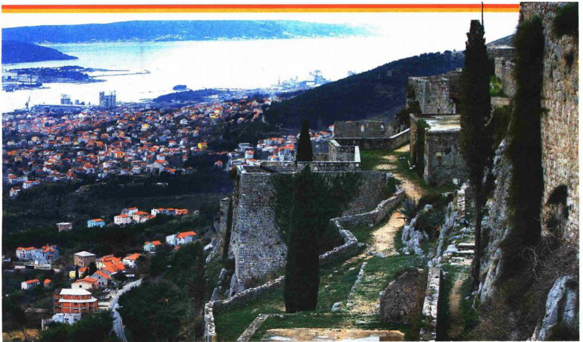
Klis - pozornica za "Igre prijestolja"