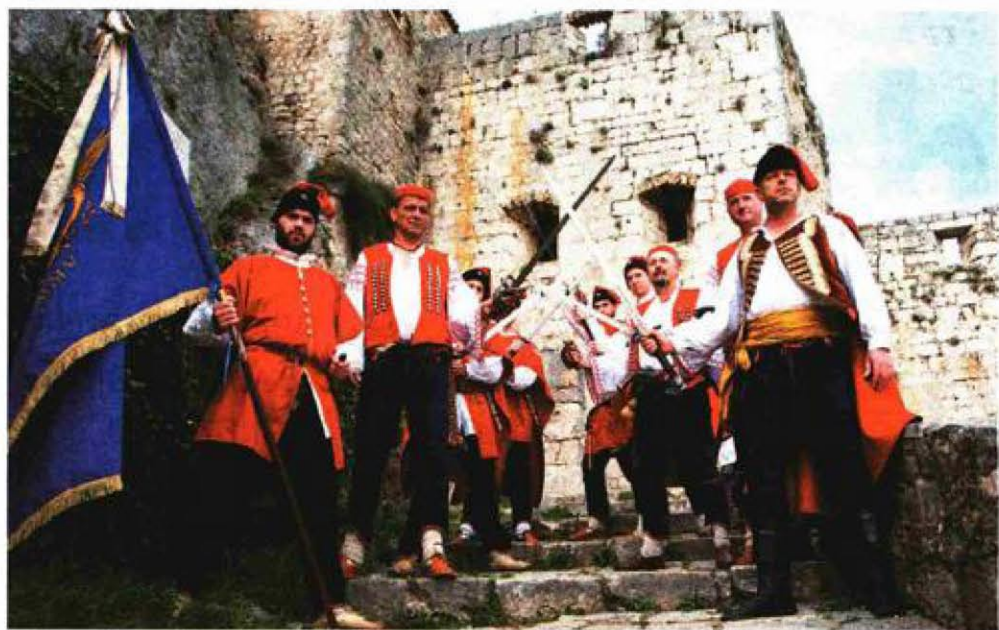
Povijesna postrojba Kliški uskoci na Kliškoj tvrđavi