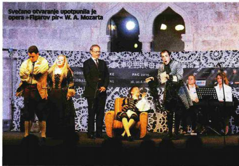
Svečano otvaranje upotpunila je opera »Figarov pir« W. A. Mozarta