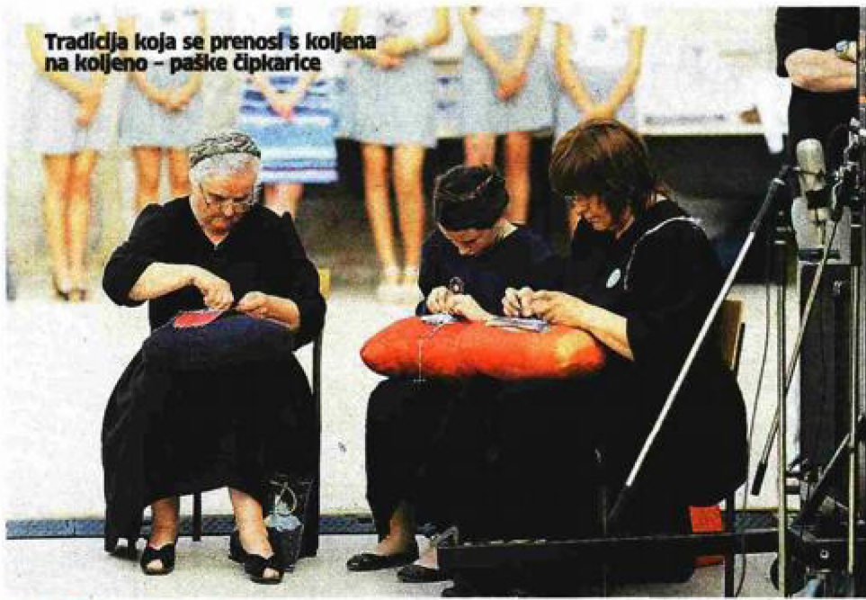
Tradicija koja se prenosi s koljena na koljeno - paške čipkarice