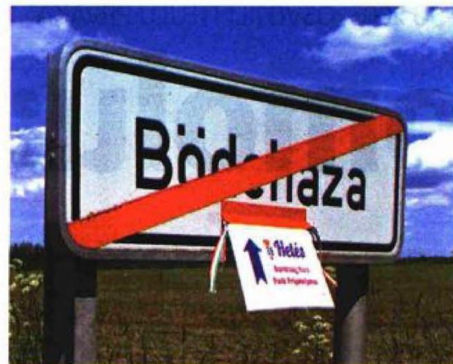
Mađarsko-slovenski Park prijateljstva pobjednik je bijenalnoga europskog natječaja za najbolji kulturni krajolik