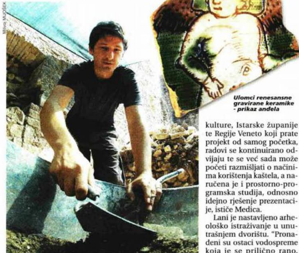
Ulomci renesansne gravirane keramike - prikaz anđela