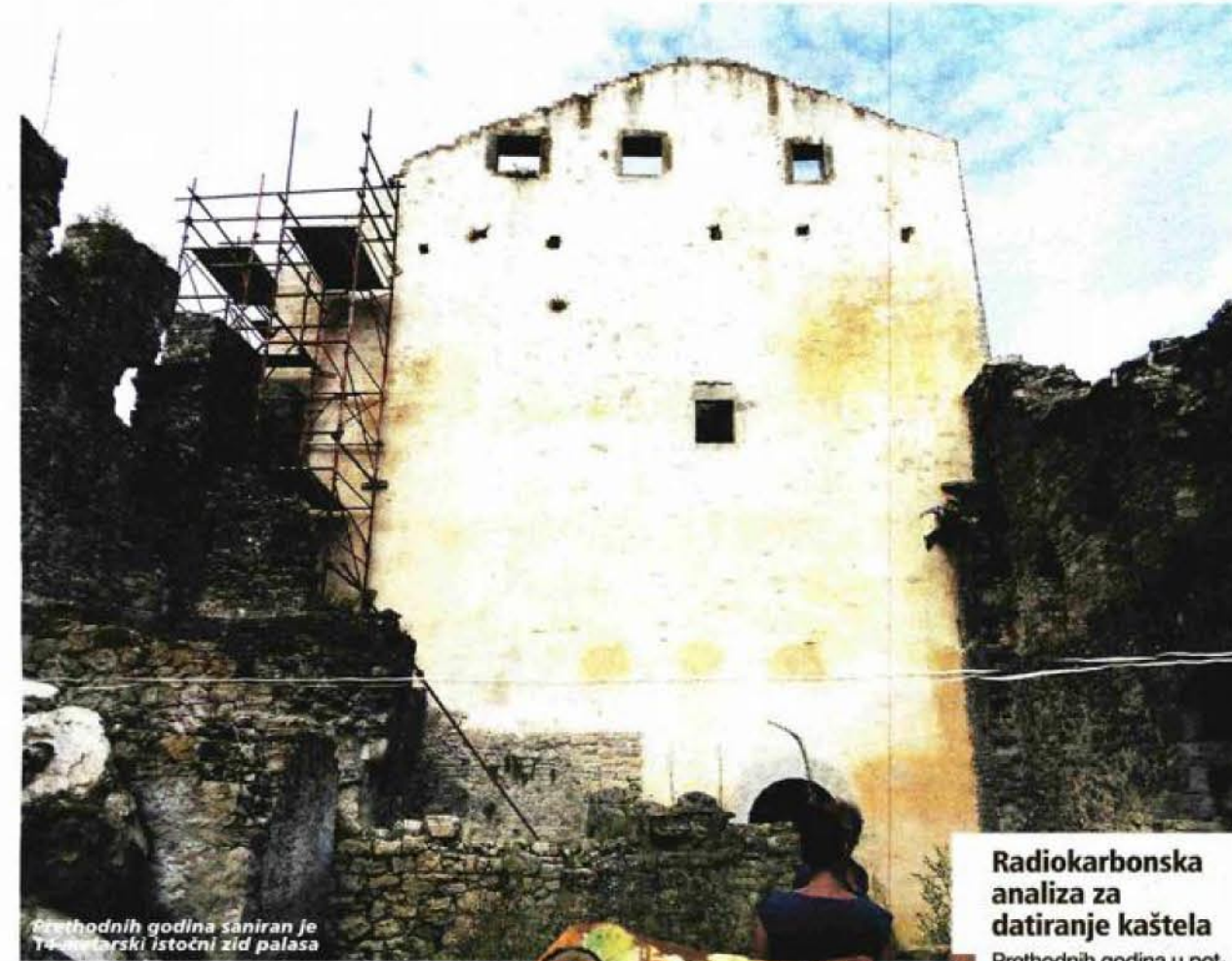
Prethodnih godina saniran je 14-metarski istočni zid palasa

Kao prioritet u nastavku sanacije kaštela nameću-