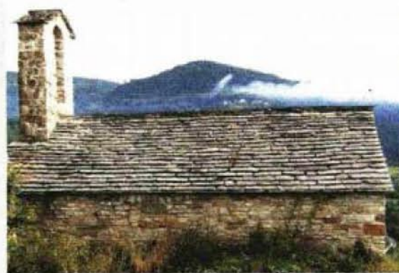
Crkvića uz sjeverni vanjski obrambeni bedem

Prvi sanirani objekt bila je ruševna crkvića sv. Marije Magdalene iz razdoblja između 11. i 13. stoljeća. Nalazi se uz sjeverni vanjski obrambeni bedem kaštela, a sanacija je trajala od 1999. do 2003. godine.