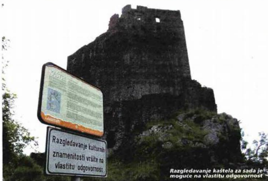
Razgledavanje kaštela za sada je moguće na vlastitu odgovornost