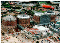
NOVA PUNJICA Objekt bi trebao biti suobnovljen i danas se u njemu nalaze i društveni sadržaji, kina, hoteli, stanovi, uređi i trgovine. Iznos je dogovoren i jedina podzemna zgrada