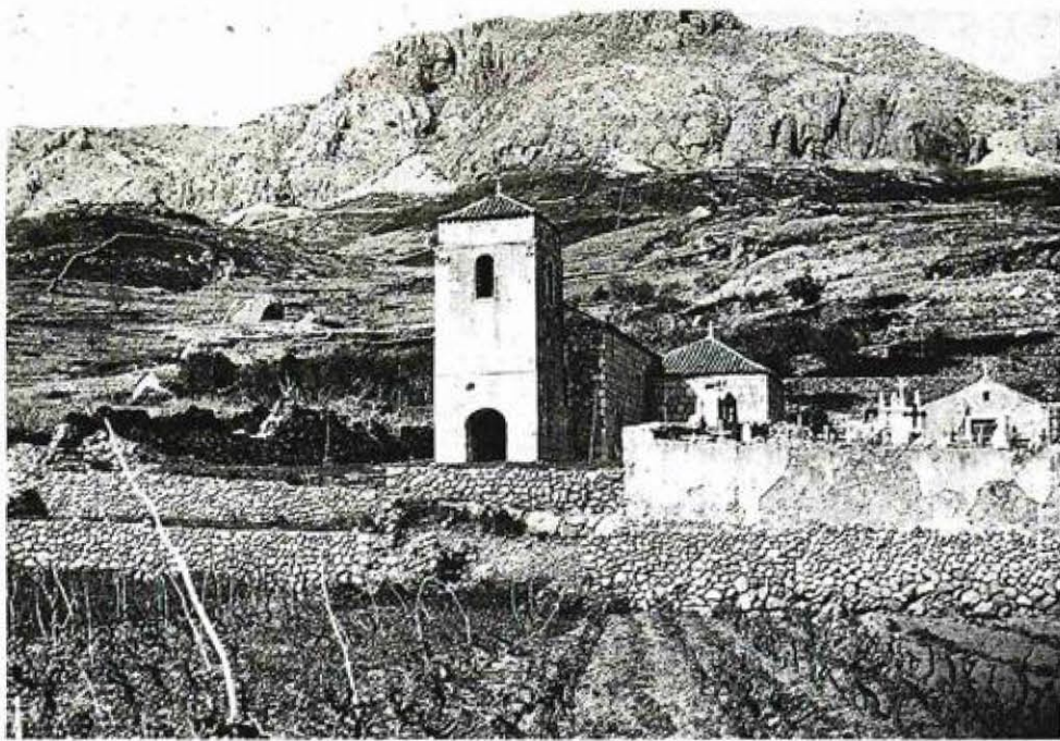
Jurandvor, crkva svete Lucije kao dio kulturnog krajolika