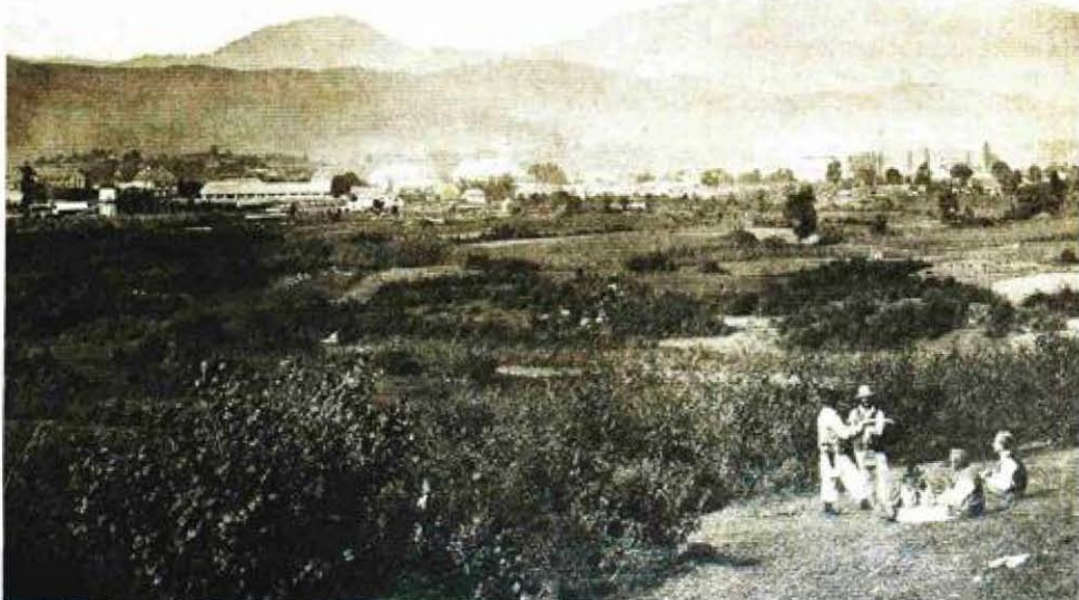
Oguljin, veduta mjesta po Klekom s pastirima (u prvom planu)