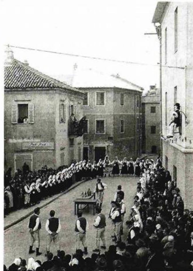
Novi Vinodolski - pokladne svečanosti na glavnom trgu

hvata mrak zaborava, upozorava Grković koja smatra da je »upravo u današnje, digitalno vrijeme, sazrio trenutak da moderna konzervatorska služba, ne samo deklarativno, već i konkretno reafirmira svoju foto-dokumentaciju, čineći sve kako bi je dalje valjano vodila i unaprjeđivala«.