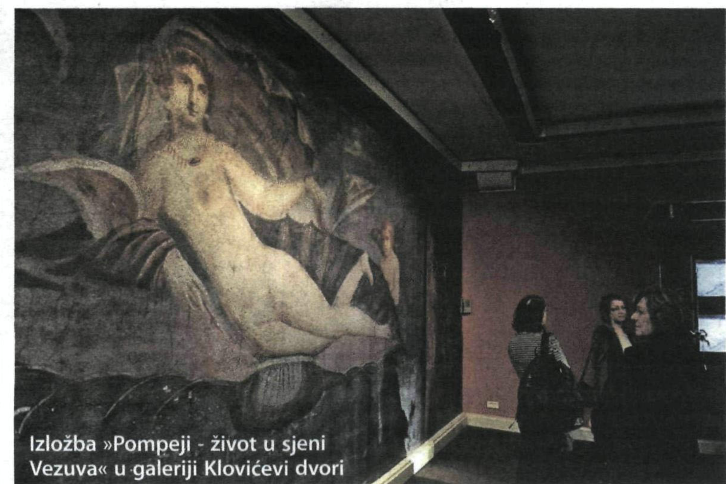
Izložba »Pompeji - život u sjeni Vezuva« u galeriji Klovičevi dvori

ZAGREB - U prigodi ovogodišnjega Međunarodnoga dana muzeja na temu koju je Međunarodni savjet za muzeje - ICOM ove godine predložio svjetskoj mreži muzeja »Muzeji i sjećanje/Predmeti pričaju tvoju priču« upućujem vam u svoje i ime Ministarstva kulture Republike Hrvatske najsrdačnije čestitke. To ističe ministar kulture Republike Hrvatske mr. Jasen Mesić čestitajući članovima Hrvatskoga muzejskog društva i Hrvatskoga nacionalnog komiteta ICOM-a, profesorima i studentima Katedre za muzeologiju Filozofskog fakulteta Sveučilišta u Zagrebu, stručnjacima, istraživačima, prijateljima i posjetiteljima muzeja, nositeljima sjećanja - Međunarodni dan muzeja, 18. svibnja. Izražavam i želju da naše muzeje i galerije pohodi što veći broj posjetitelja te zahvaljujem svima koji su sudjelovali u ostvarenju ove važne manifestacije kojom pridonosite i promicanju kulture u suvremenom društvu, stoji u čestitci ministra Jasena Mesića muzealcima. [K. R.]