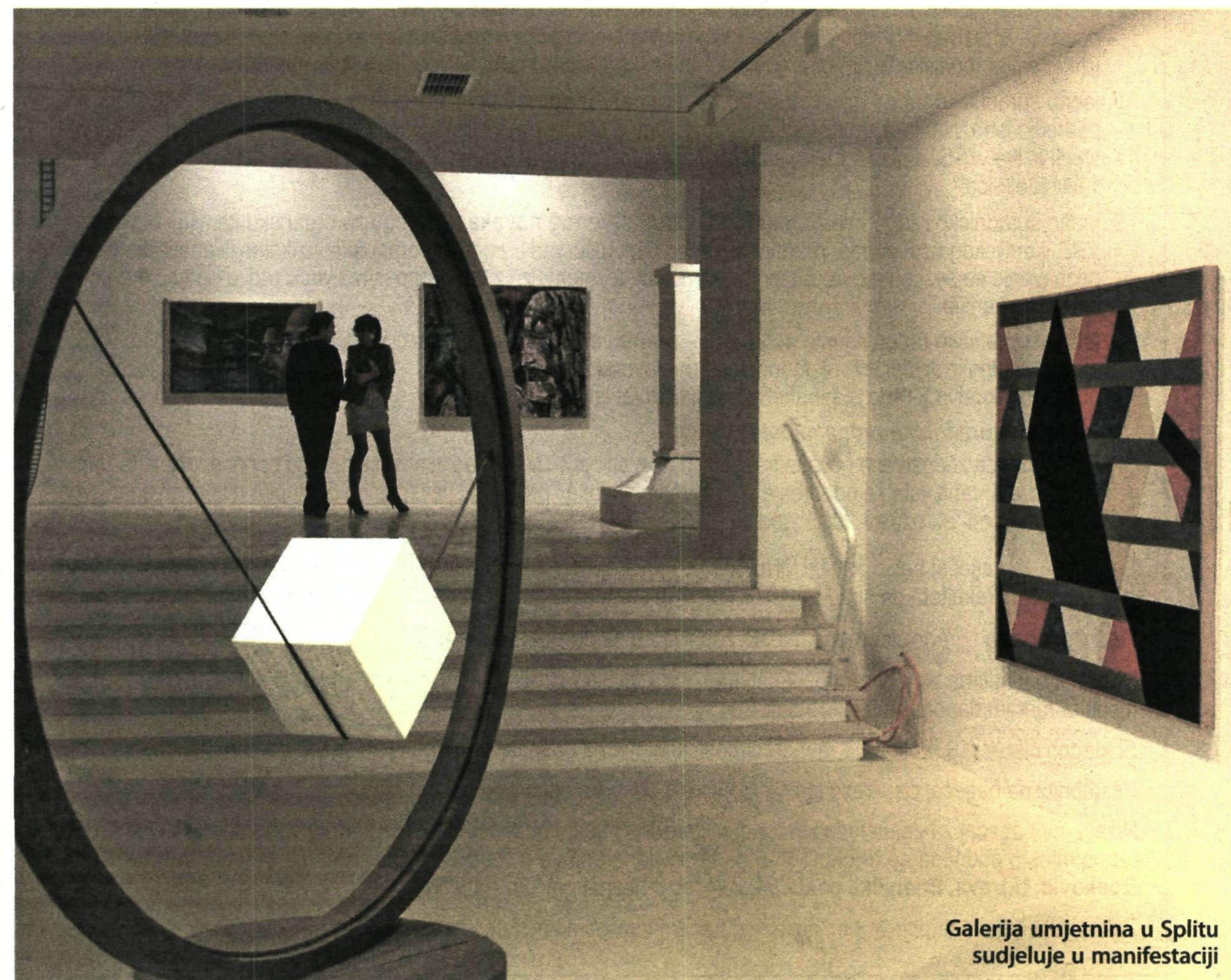
Galerija umjetnina u Splitu sudjeluje u manifestaciji