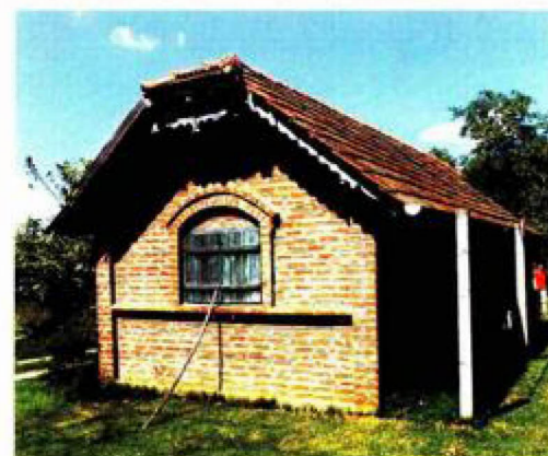
Preslika seoske kuće Tip zidane klijeti jedinke iz polovice 20. stoljeća snimljen je na Čukljaševu brijegu (Cirik) kod Budrovca