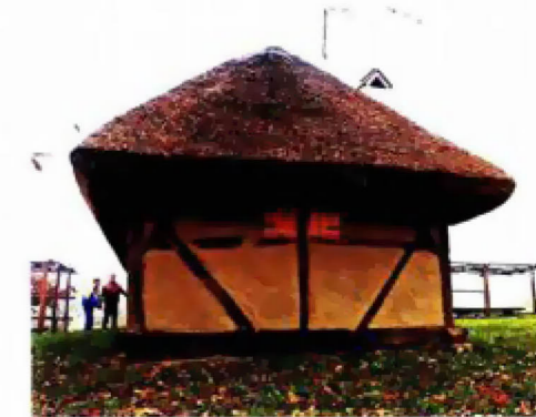
Zaštićena klijet Na Staroj gori kod mjesta Virje nalazi se klijet iz 19. stoljeća koja je na popisu zaštićene ruralne baštine Ministarstva kulture

Tijekom 19. stoljeća zbog promijenjenih gospodarskih uvjeta, tj. pojačanog iskorištavanja šuma, dolazi do racionalnije upotrebe drvene grade. To je utjecalo i na daljnje oblikovanje zgrada klijeti pa se planjke, koje su dotad predstavljale nosivu konstrukciju, javljaju samo kao ispunja drvenog kostura kanatne konstrukcije. Temelj građevine su masivne grede (poceki), a nosivost konstrukcije se, umjesto na zidove, prebacuje na vertikalne stupove (podboje) ukrućene koso i vodoravno položenim potpornjima (panti-ma), karakteristično vidljivima izvana. Kao ispune zidova upotrebljavale su se krače, te-