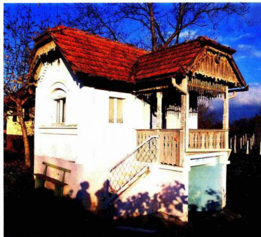
Klijet bogatijega gazde Male vinogradarske vile s natkrivenim terasama (verandama) građene su šezdesetih godina 20. stoljeća i na Čukljaševu brijegu kod Budrovca

Iako je brojnim adaptacijama većina starih klijeti izgubila auru autentičnosti, do danas sačuvani objekti vrijedni su svjedoci znanja seoskih graditelja i njihova poznavanja materijala i prirode. U procesu revitalizacije i očuvanja ruralne graditeljske baštine u Podravini najvažnije je i dalje graditi svijest o vrijednosti klijeti i potrebi njihove daljnje zaštite. 📸