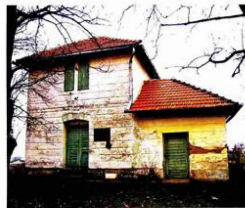
Galovičeva klijet Jedna od rijetkih očuvanih ladanjskih klijeti je i ova hrvatskoga književnika Frana Galovića na Širovicama južno od Koprivnice

vano vrlo malo ovakvih klijeti, a jedna od najpoznatijih je ona podravskog pjesnika Frana Galovića na brijegu Širovica kod Koprivnice.