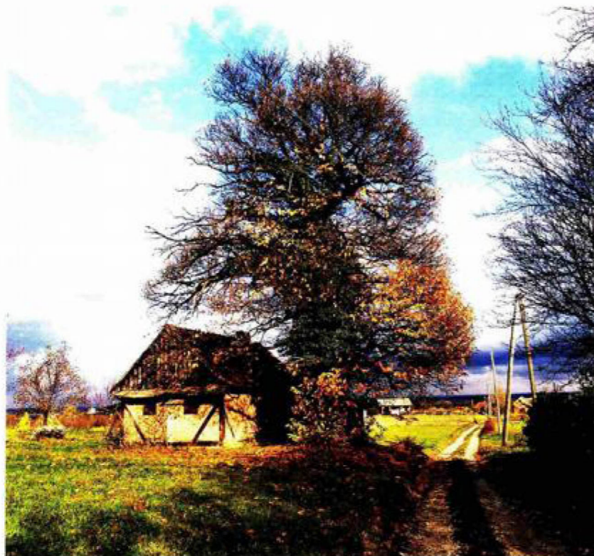
Znak raspoznavanja Stabla pitomog kestena sadila su se uz klijeti podravskog dijela sjeverozapadne Podravine i čine posebnu ambijentalnu vrijednost gorica na Bilogori

Uz bogatiji sloj građana ili seljaka javlja se i ladanjski tip klijeti u kojima je ujedinjena funkcija klijeti i ladanjske kuće. Građene su kao zidane katnice većih dimenzija, izduženog pravokutnog tlocrta ili pak na polovini jedne strane oblikovane kao katnice, dok je druga bila izvedena kao prizemnica. Zaključene su četverostrešnim ili pak dvostrešnim krovom prekrivenim crijepom. Raspored prostorija bio je prilagođen potrebama lagodnijeg života. Prostorije gospodarske namjene redovito su bile smještene u prizemlju objekta s podrumskim prostorijama za spremanje vina i štalama za konje. Kat predviđen za odmor i dokolicu rastvoren je velikim prozorima, a najčešće i terasom na pročelju. Budući da su ovakve vile bile građene na atraktivnim lokacijama, terasa zamišljena kao vidikovac redovito je bila okrenuta prema lijepom pogledu. Drveni dijelovi terase bogato su ukrašeni rezbarenim motivima geometrijske ornamentike pa su ujedno i glavni ukras građevina. Do danas je saču-