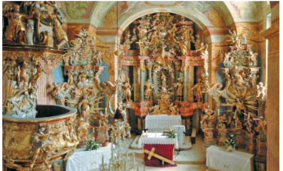
Župna crkva Marije Snježne u Belcu