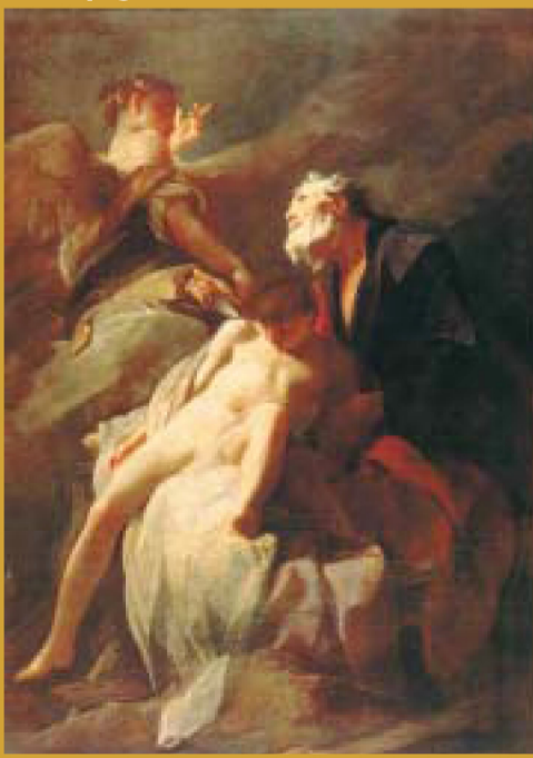
Federico Benković: »Žrtva Abrahamova«, Venecija, 1715.

»Projekt je započeo 2005. godine, paralelno s početkom recesije u Europi. Eva Schubert je računala na međunarodno financiranje projekta, kakvo je imala tijekom izložbe 'Otkrijmo islamsku umjetnost', ali to se nije dogodilo. Jedine zemlje koje su od početka imale osiguran novac za sudjelovanje bile su Češka, Portugal i Hrvatska. Svi drugi su vrlo teško našli financijere«, ističe Mirjana Repanić Braun.