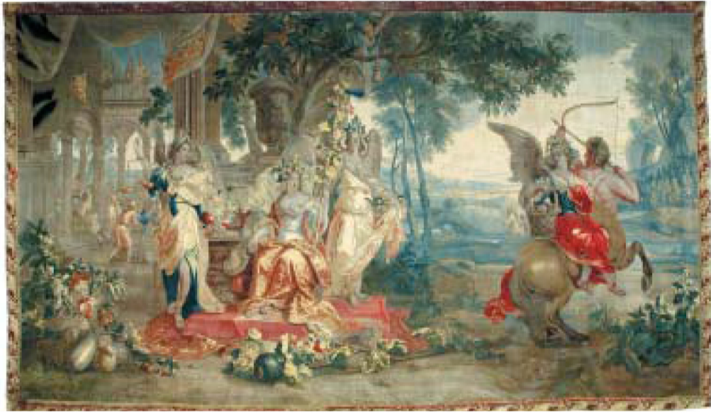
»Alegorija jeseni«, dio serije tapiserija »Četiri godišnja doba«, Bruxelles oko 1700.