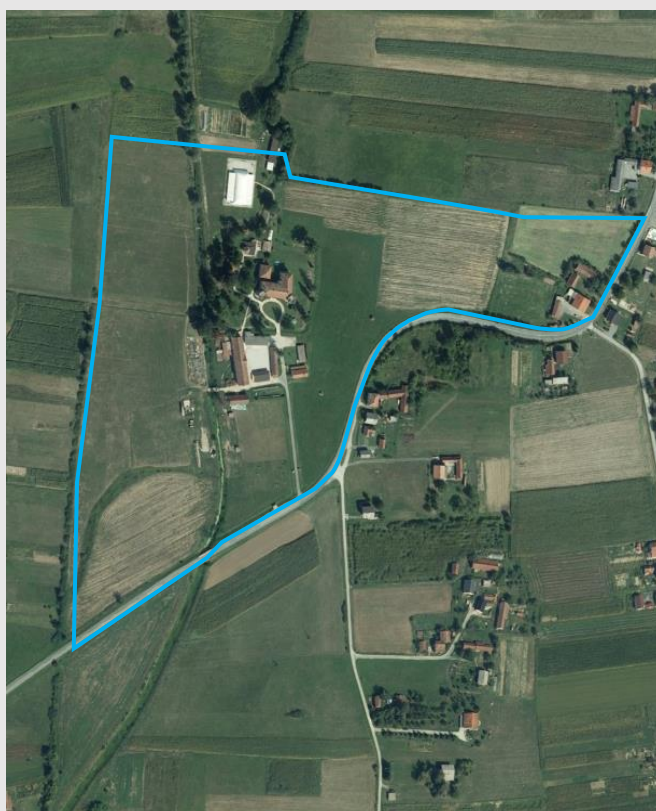
Povijesni katastar imanja iz 1860. godine, zona zaštite na DOF podlozi