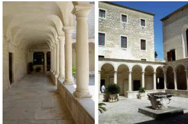
Samostan sv. Franje

Crkva sv. Frane najstarija je dalmatinska crkva sagrađena u gotičkome stilu (posvećena je 13. studenoga 1280.). Samostan je osnovan još za života sv. Franje Asiškoga, po predaji i u izravnoj svezi s njime. Izrastao je iz hospicija sv. Antuna Opata na zapadnome dijelu grada, u kojem se po predaji sklonio sv. Franjo Asiški za boravka u Zadru, najvjerojatnije 1212. godine. Izgradnja današnjega samostana započeta je za nadbiskupa Lovre Periandra 1249. i u prvotnom obliku završena je do kraja stoljeća. Samostan je već od početka sjedište franjevačke provincije sv. Jeronima u Dalmaciji i Istri (službeni naslov od 1393. godine). Renesansni klaustar s bogatom bibliotekom sagrađen je južno od crkve 1556. godine. Samostan je tijekom svoje bogate višestoljetne prošlosti bio žarište duhovnoga života u Zadru, a u njemu je djelovalo i Visoko franjevačko