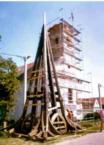
Crkva sv. Mihaela Arkandela, za vrijeme obnove

izvode konzervatorsko-arheološka istraživanja te radovi obnove i zaštite.