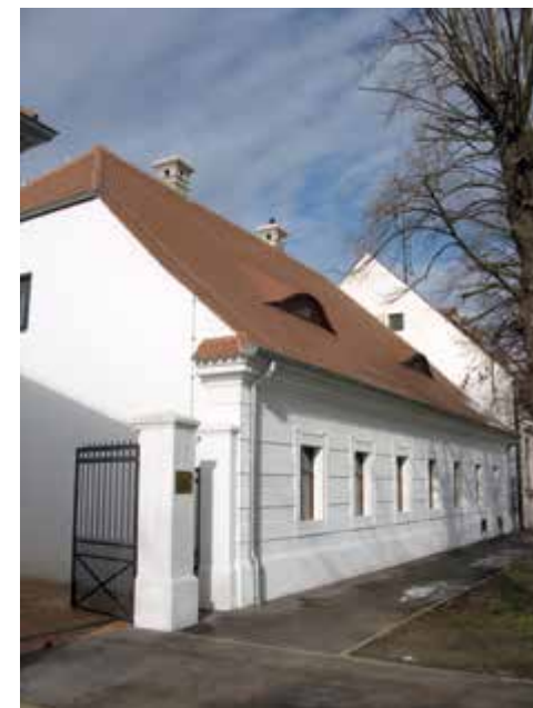
Kurija, 2014. g.

ORGANIZATOR: Konzervatorski odjel u Vukovaru