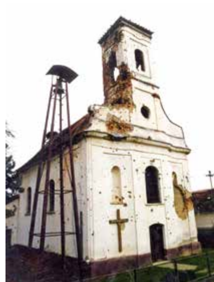
Crkva sv. Mihaela Arkandela, prije i poslije obnove

KO u Slavonskome Brodu obilježit će Dane europske baštine izložbom u prostoru Galerije umjetnina grada Slavnskoga Broda od 30. rujna 2014. do 17. listopada 2014. godine. U sklopu izložbe prezentirat će se kulturna dobra koja se nalaze na prostoru Brodsko-posavske županije na kojima se trenutno