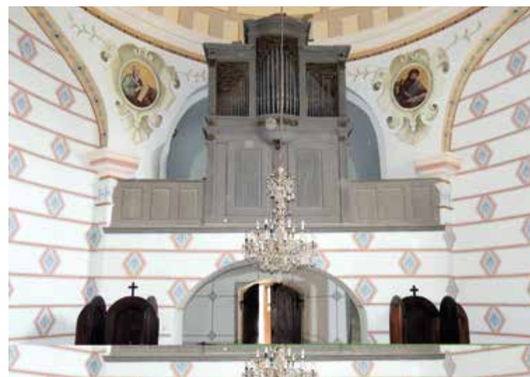
Crkva sv. Franje Ksaverskog – Glavni oltar sv. Franje Ksaverskog