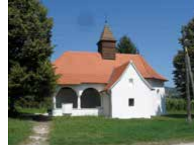
Kuzminec, Kapela sv. Marije Magdalene (vrata prije i poslije radova)