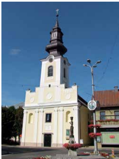
Župna crkva Navještenja Blaženoj Djevici Mariji

Gospićka župna crkva Navještenja Blaženoj Djevici Mariji izgrađena je tek 1781. - 1783. godine po propisanome tipu krajiških crkava za gradske sredine. U turskim izvorima spominje se 1574. Gospojino Selo, a 1604. nalazimo ime Gospić, što otvara mogućnost postojanja neke srednjovjekovne crkve s Gospinim imenom. Prvi poznati crkveni patron Gospića bio