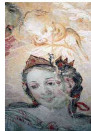
Detalj nakon skidanja preslika