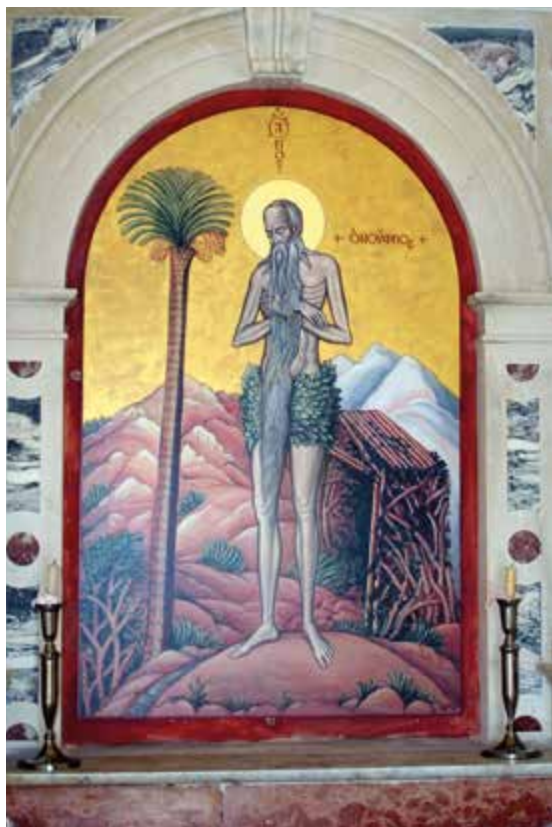
Kopija originalne ikone sv. Onofrija iz 17. stoljeća

ORGANIZATOR: Konzervatorski odjel u Trogiru