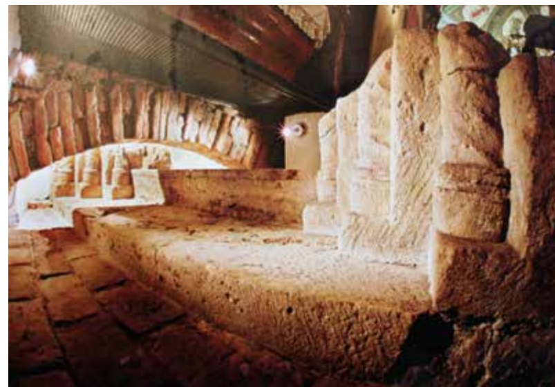
Sačuvani fragment portala