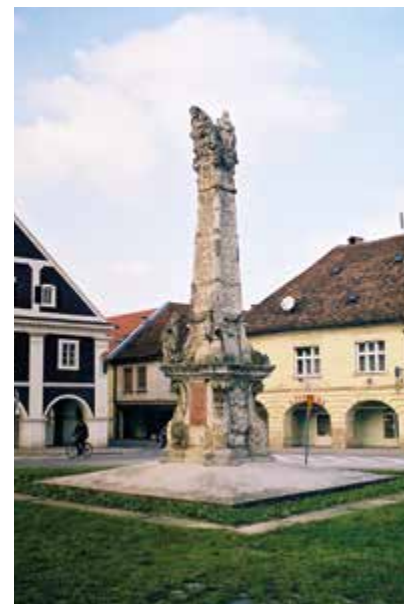
Kužni pil (prije i poslije obnove)

ORGANIZATOR: Konzervatorski odjel u Požegi