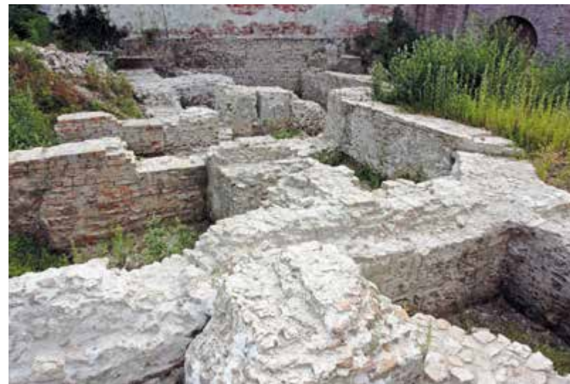
Pogled na svetište