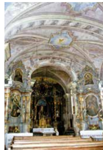
Crkva sv. Florijana, za vrijeme obnove

Crkva sv. Florijana podignuta je kao zavjetna crkva varaždinskih obrtnika uz staru gradsku prometnicu koja prati bedeme oko Staroga grada. Na mjestu starije drvene crkve nastaje tijekom 18. stoljeća nova zidana građevina, čija je izgradnja trajala od 1733. do 1752. godine, dok su sakristija i zvonik po-