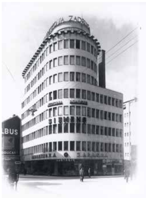
Stjepan Planić, Zgrada Napretkove zadruge, 1936.

Arhiv Stjepana Planića broji oko 700 projekata, pohranjen je u Institutu za povijest umjetnosti u Zagrebu i upisan u registar pokretnih kulturnih dobara Republike Hrvatske.