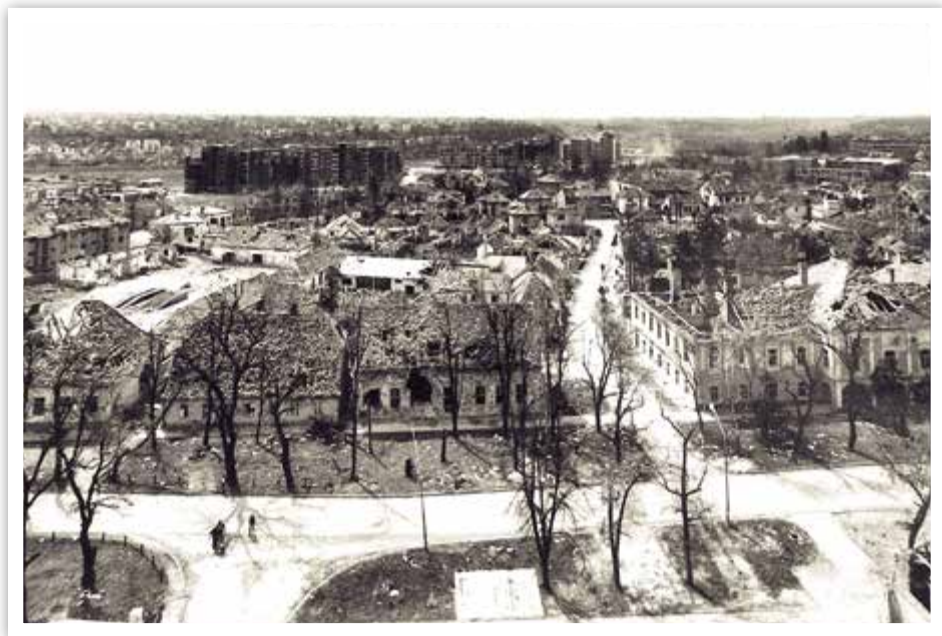
Kurija, Červenka, 1991. g.

Izgrađena je u drugoj polovini 18. st. za potrebe nadzorništva vlastelinstva, kao četvrta u nizu kurija u kojima je bila smještena uprava vlastelinstva.