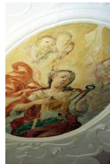
Stanje medaljona prije završnog retuša

Ovi vrijedni oslikani medaljoni, koji su izišli na vidjelo skidanjem preslika, oslikani su tehnikom fresco secco. Na temelju stilskih obilježja te prema načinu građenja crteža i morfologije likova ovi prikazi mogu se pripisati varaždinskomu slikaru Blažu Gruberu, koji u Varaždinu djeluje kao značajan predstavnik baroknog iluzionističkog slikarstva. Kako se na trijumfalnome luku nalazi latinski natpis s godinom 1738., koji je kronološki i stratigrafski sukladan baroknim slikama, smatra se da je i oslik u medaljonima nastao u tome razdoblju.