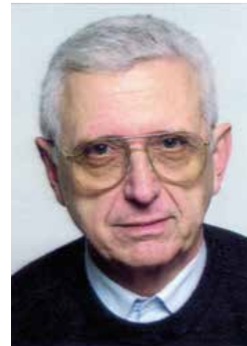
akademik Nenad Cambi

Kao profesor Filozofskoga fakulteta u Zadru podigao je brojne mlade istraživače i bio im mentor u njihovome znanstvenom radu. Autor je velikoga broja znanstvenih i stručnih radova za koje je dobio značajna priznanja. Bio je i član uglednih znanstvenih organizacija, među kojima Hrvatske akademije znanosti i umjetnosti.