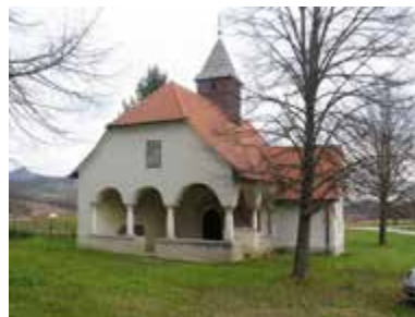
Kuzminec, Kapela sv. Marije Magdalene (prije i poslije radova)