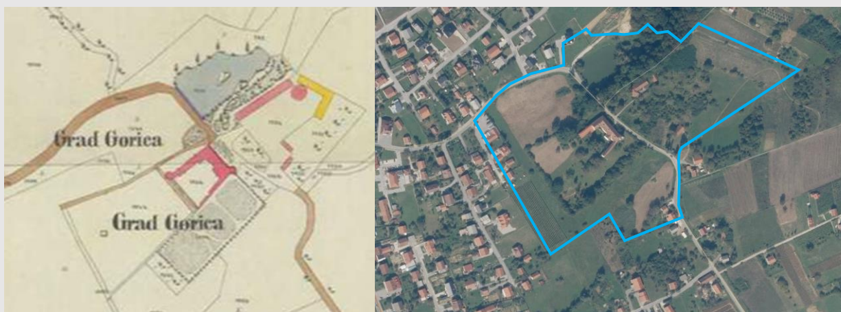
Povijesni katastar imanja iz 1861. i zona zaštite na DOF podlozi