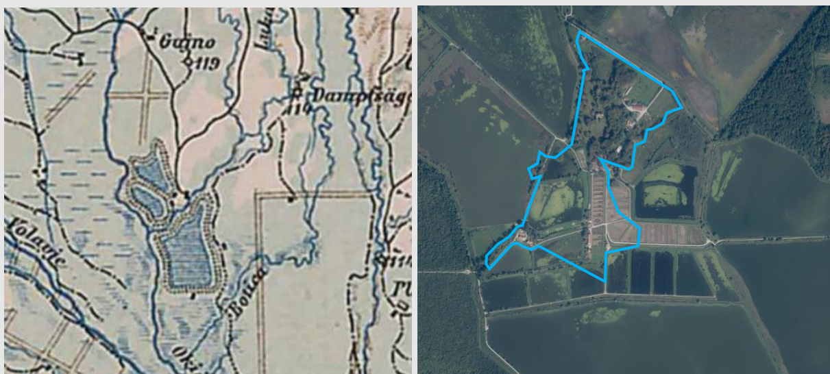
Povijesni katastar (Opća karta Mađarske, oko 1910.), zona zaštite na DOF podlozi