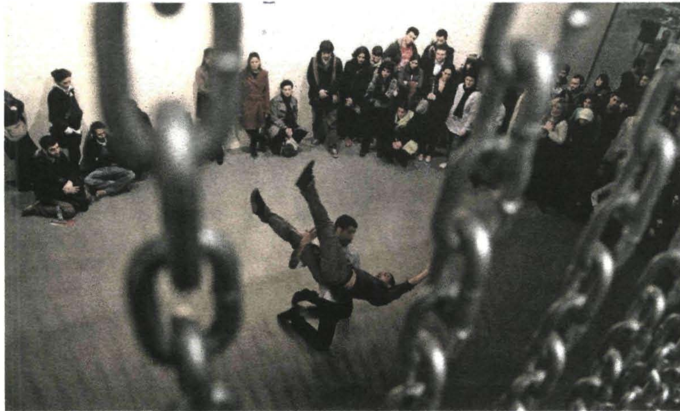
Tijekom jednog od brojnih gostovanja projekta »Seas« u kojem je sudjelovala i naša skupina Bad Co.

Izvedbeni kolektiv Bad Co. bio je dio velikog projekta »Seas«