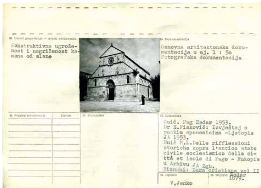
2 Kartica osnovne evidencije spomenika kulture s uloženom karakterističnom fotografijom - naličje (MK-UZKB/SA)

Card of main records of monuments of culture with inserted characteristic photograph - reverse (Ministry of Culture - Directorate for the Protection of Cultural Heritage/ Central Archives)