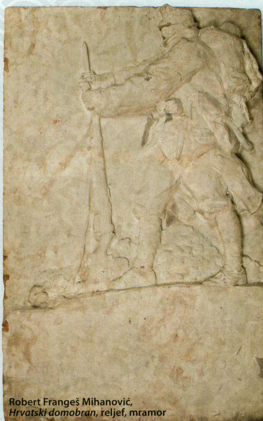
Robert Frangeš Mihanović, Hrvatski domobran , reljef, mramor

Obilježavajući stotu obljetnicu početka Prvoga svjetskog rata, iz te bogate Zbirke odabrana su djela, od kojih se mnoga sada prvi put izlažu. Grupirana su u nekoliko cjelina – vladari, saveznici i neprijatelji, zapovjednici i visoki časnici, pripadnici različitih postrojbi, prikazi bitaka na raznim ratištima te hrvatski ratni slikari i kipari, a upotpun-