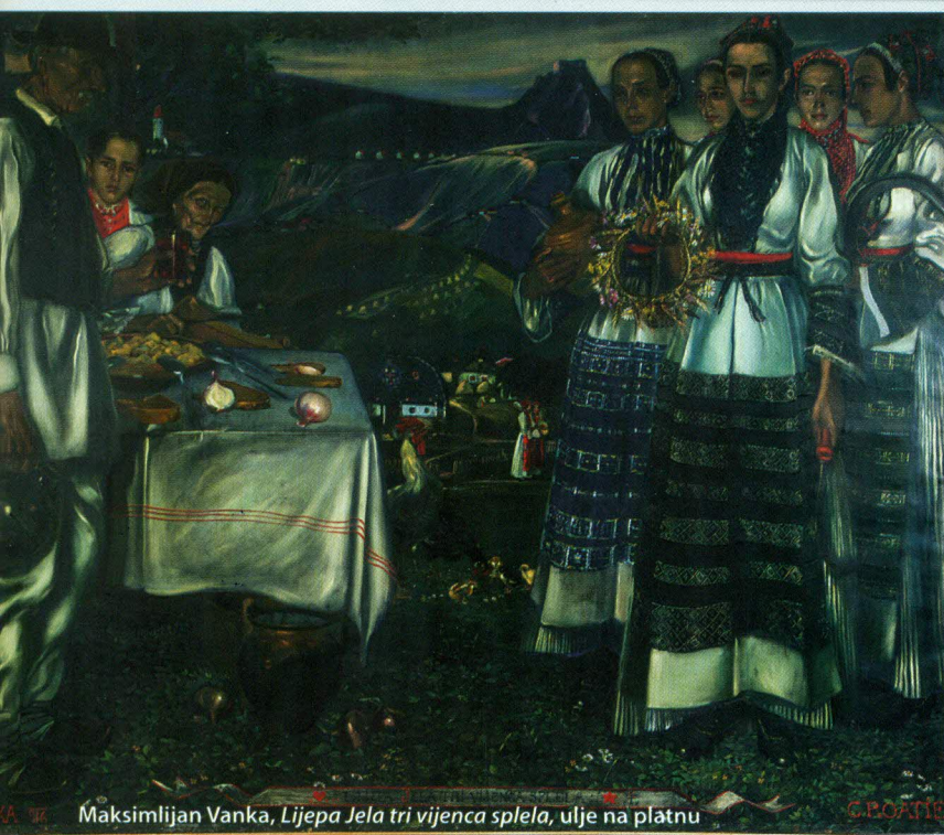
Maksimijan Vanka, Lijepa Jela tri vijena splela , ulje na platnu