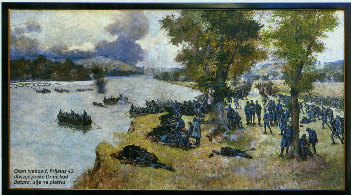
Oton Iveković, Prijelaz 42. divizije preko Drine kod Batara , ulje na platnu