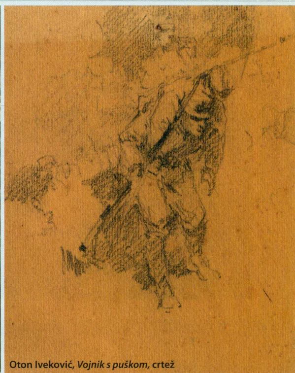
Oton Iveković, Vojnik s puškom , crtež

liciji. Djela Oskara Artura Alexandra nastala u vrijeme Prvoga svjetskog rata ovom prilikom također se prvi put izlažu. Alexander je kao ratni slikar boravio najviše na sočanskom ratištu, prateći borbe zrakoplova, portretirajući odličnim crtežima niz ratnih pilota i portretirajući ih u ulju. Na kraju izložbe multimedijalno su predstavljena djela nastala u Hrvatskoj u ratnim godinama i neposredno nakon kraja rata – bakropisi Mencija Clementa Crnčića i Branka Šenoa, portreti Bele Čikoša Sesije i Gabriela Jurkića, akvareli Milenka Gjurića te reljef sa zgrade Hrvatskoga sabora, djelo Ive Kerdića iz 1918. godine, vezan uz osnutak Države Slovenaca, Hrvata i Srba.