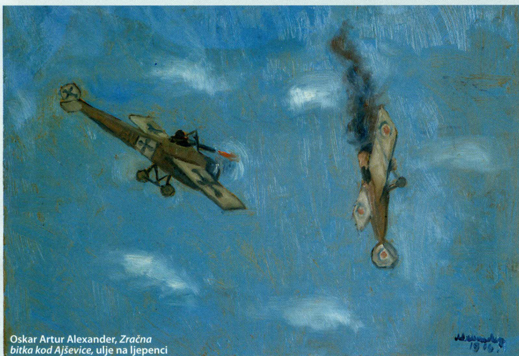
Oskar Artur Alexander, Zračna bitka kod Ajševice , ulje na ljepenci

U muzejskoj Zbirci čuva se i nekoliko vrijednih djela Bogumila Cara nastalih za vrijeme njegova služenja na sočanskom ratištu. Anđelko Kaurić odličnim je crtežima tušem zabilježio borbe u Ga-