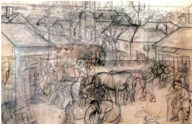
9. Krsto Hegedušić: Zeleni kader