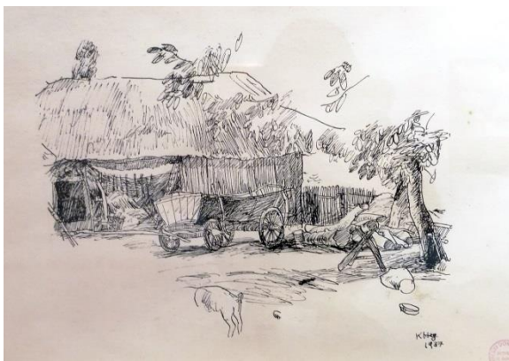
3. Krsto Hegedušić: Seosko dvorište