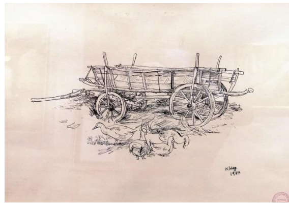
4. Krsto Hegedušić: Guske u dvorištu