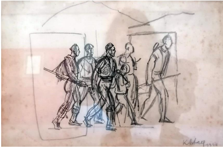
7. Krsto Hegedušić: U pokretu