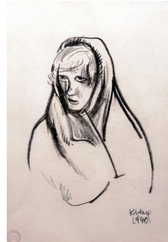
8. Krsto Hegedušić: Portret majke