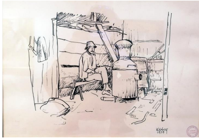
2. Krsto Hegedušić: Pecar rakije