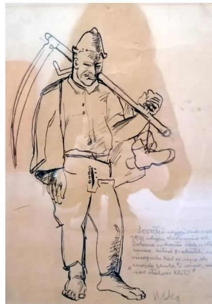
6. Krsto Hegedušić: Lik seljaka