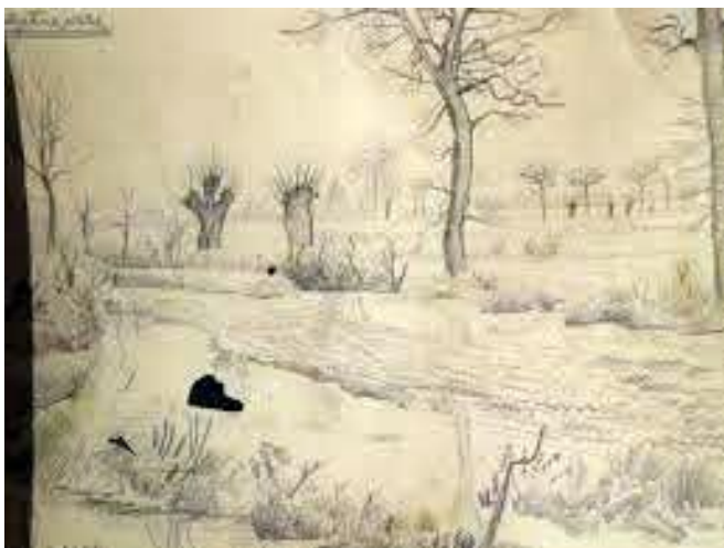
11. Krsto Hegedušić: Prolječne vode