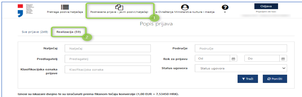
Slika 1 Podnesene prijave - kartica Realizacija

Potrebno je odabrati karticu Realizacija kako biste došli do modula koji se odnosi na ispunu i predaju izvještaja o realizaciji za Vaše odobrene prijave ( Slika 1 Podnesene prijave - kartica Realizacija – broj 2 ).